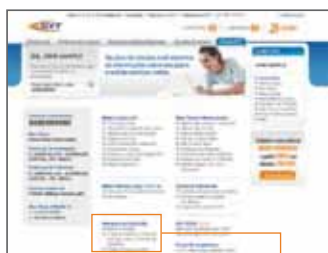
Serviços de Proteção Baixar e Instalar

1 Entre em nosso portal www.gvt.com.br e acesse “Área de Cliente”.